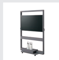
スプリント モニタースタンド