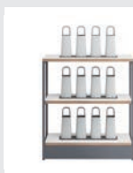
ライブシェルフ シェルフユニット