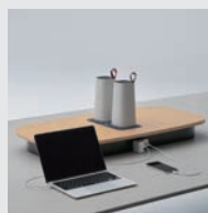
ワークキャリア アドオンプレート