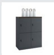
ビクスライン 天板